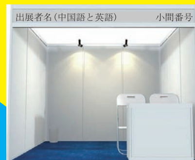
パッケージブースイメージ図